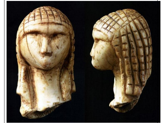
Dame de Brassempouy. Fragment de statuette en ivoire ancienne de 20 à 30 000 ans AP. C'est la plus ancienne représentation d'un visage connue.