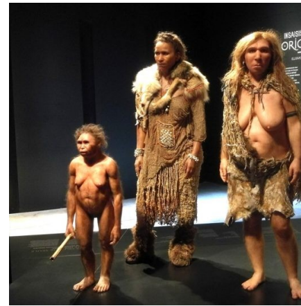
Australopithèque, Sapiens et Néandertal. Reconstitutions présentées au musée des confluences de Lyon.