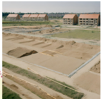
Disparition des terres agricoles