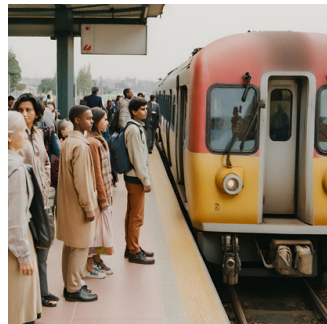
Habiter à la campagne, travailler en ville