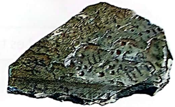
Pierre servant à recouvrir les sépultures