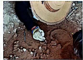
Dégagement d'un squelette par un archéologue