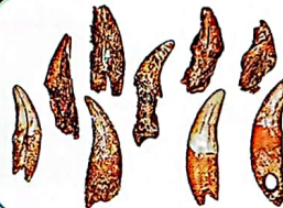
Dents d'animaux montées en pendentifs