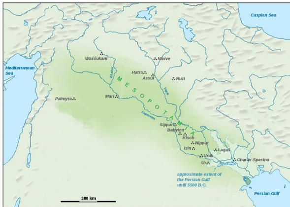
Carte de la Mésopotamie au IVe millénaire.