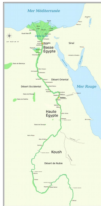
Carte de l'Égypte à l'époque pharaonique.