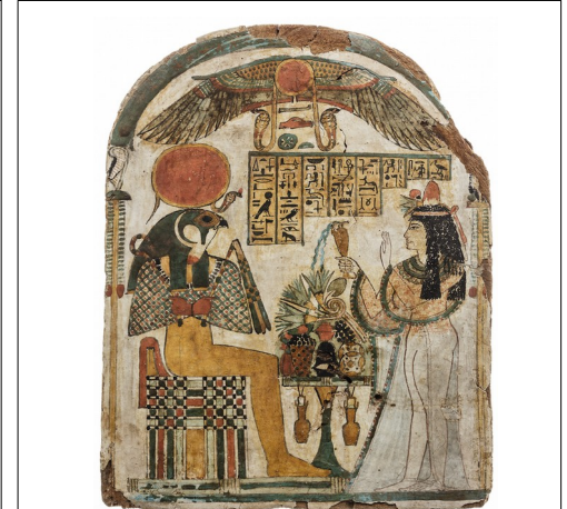
Stèle funéraire de Djed-Khonsu-es-anekh. Découverte dans le Ramesseum, cette peinture murale montre une scène d'offrandes au dieu du soleil Râ.