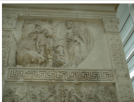
Enée apportant ses pénates en Italie. Bas relief de l'Ara Pacis à Rome. Source : Wikipédia)

Les Lares Praestites sont celles de la ville de Rome.