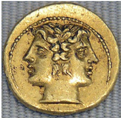
Demi statère romain en or représentant Janus bifrons.