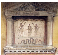
Laraire de la Casa dei Vettii à Pompéi.

Pour l'honorer, il y a à Rome un groupe de prêtresses, les vestales, qui font partie des personnes les plus importantes de la cité.